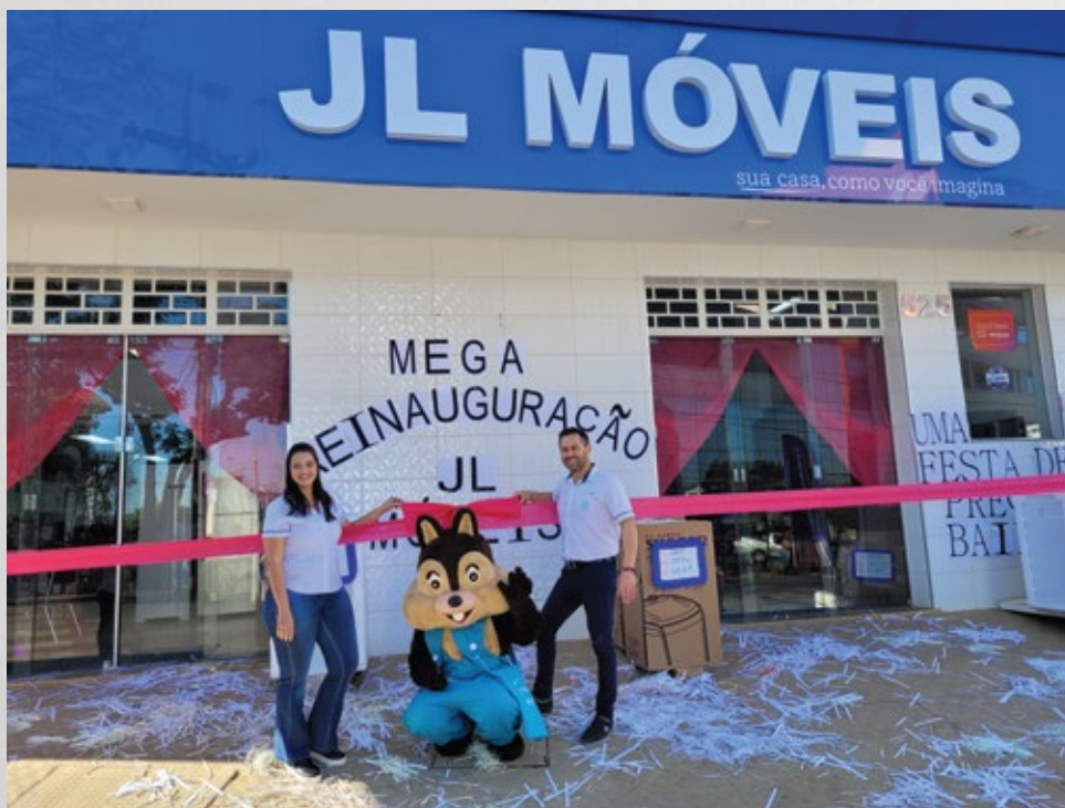
Novo endereço da loja matriz na Rua Luis Alves n°525 Centro, Carmópolis de Minas

Se você está renovando sua casa, a JL Móveis é a melhor opção. As lojas estão localizadas no centro de Carmópolis de Minas, uma à Rua Padre Francisco, 281 centro e a outra, recém reinaugurada em novo local: Rua Luiz Alves, 525- Centro.