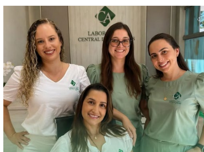
Laboratório Central de Análises